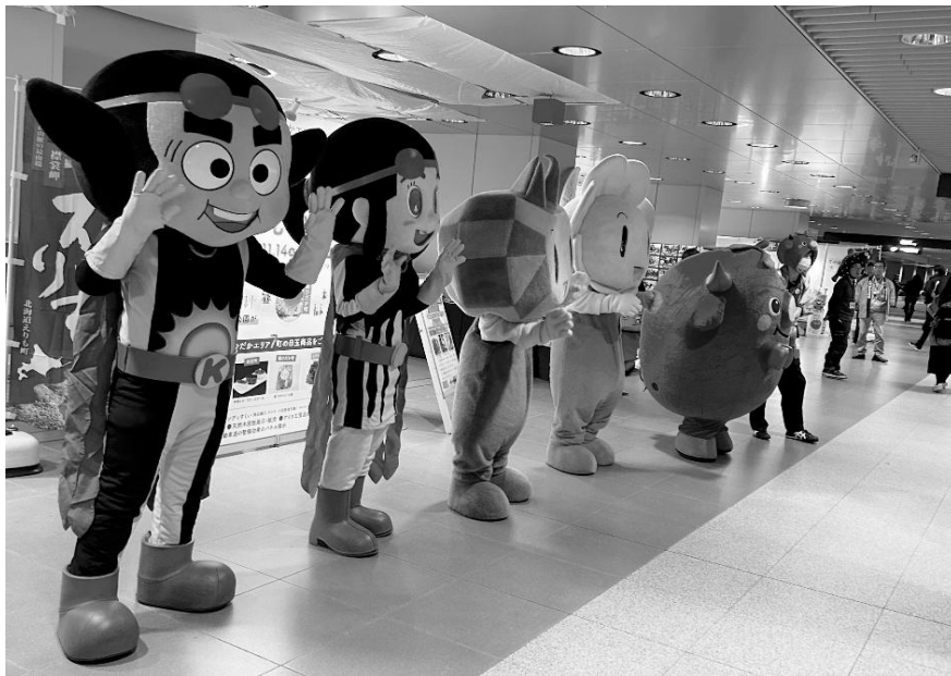
各町のゆるキャラたちも皆さまのご来場をお待ちしております！