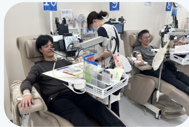
▲献血活動（札幌支店）