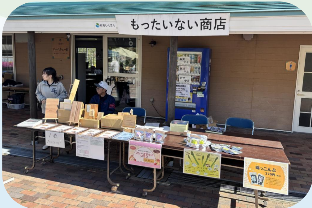
▲うらかわマルシェの様子

令和7年9月21日、浦河町で開催された「うらかわマルシェ」に参加しました。当金庫は「日高しんきん もったいない商店」として出店し、地元事業者と連携しながら、各事業者が保有する未利用素材や、規格外野菜等未利用資源を活用した商品の販売、取り組みPRを行いました。