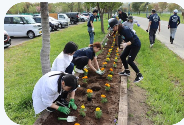
▲うらかわ優駿ビレッジAERU ウエルカムロード花壇整備 (浦河地区合同)