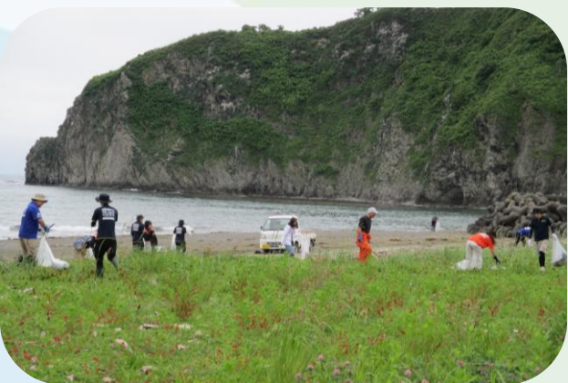
▲エンルム岬DEゴミ拾い (様似支店)