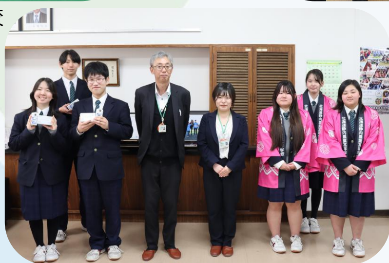
▲ 静内農業高等学校