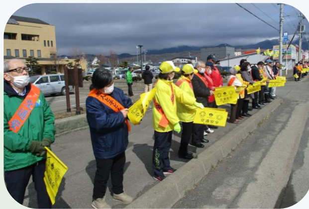
▲旗の波運動（様似支店）