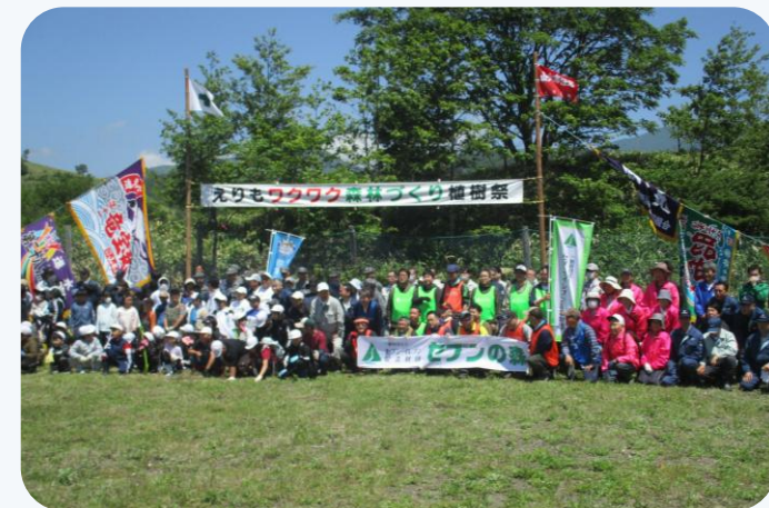
▲えりもワクワク森林づくり体験事業 植樹祭