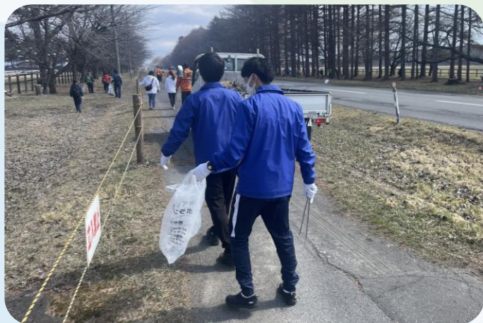
▲二十間道路桜並木環境保全活動