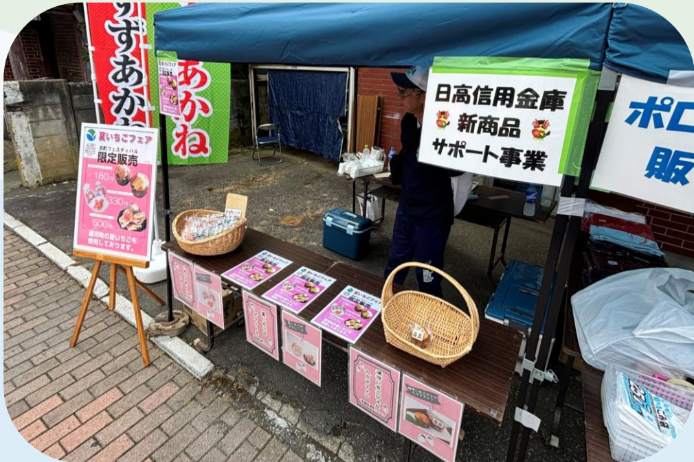
▲うらかわ夏いちごの日イベントの様子

イベントでは「新商品開発サポート事業」において令和5年度から令和6年度に開発された商品を販売し、PRを行いました。