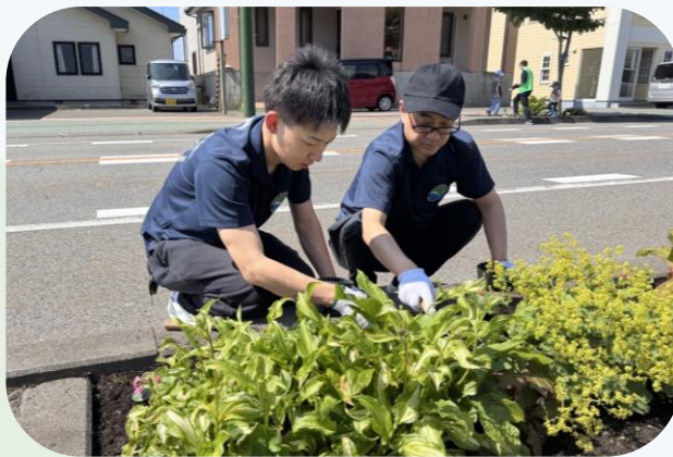
▲みついし花遊会との花壇整備 (三石支店)