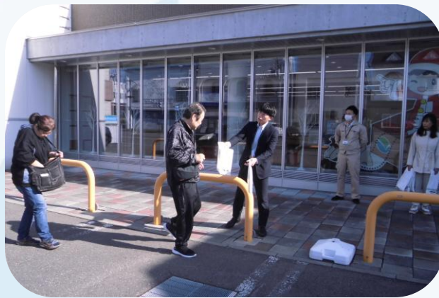
▲詐欺防止街頭啓発（広尾支店）