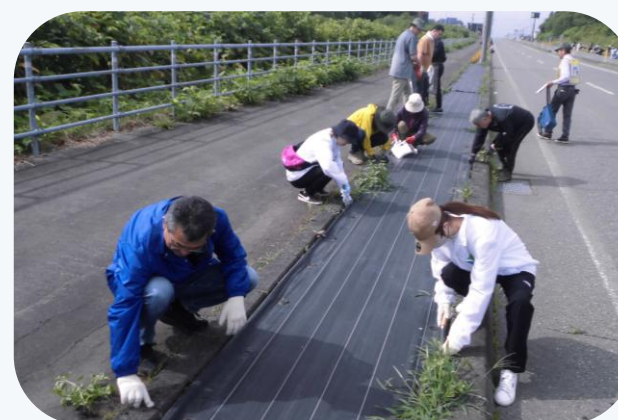
▲第21回ルート336花壇づくり 草取り (広尾支店)