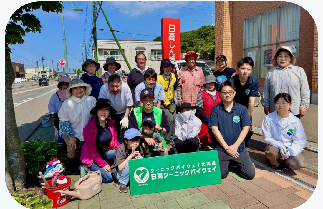
▲みついし花遊会との花壇清掃（三石支店）