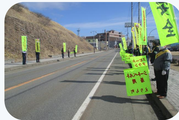
▲旗の波啓発作戦（えりも支店）