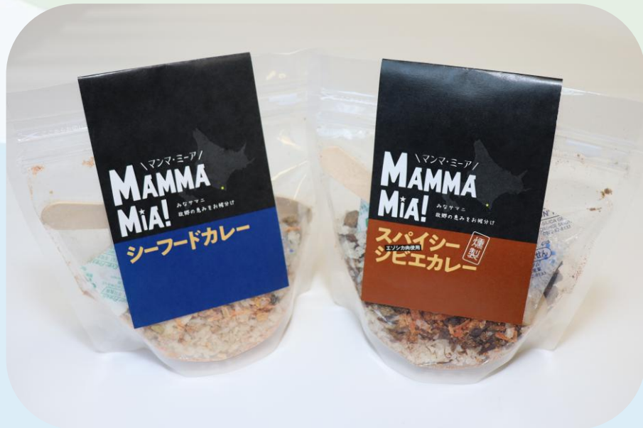
▲左からシーフードカレー、 燻製スパイシージビエカレー

地域資源を活かした商品開発を支援する「新商品開発サポート事業」を実施しました。今年度は「まんまのまんま」（様似町）が(公財)北海道科学技術総合振興センターの「地域産業クラスターものづくり支援事業」（以下、HOF00プロジェクト）を活用し、地元食材を使った登山食「MAMMA MIA!（マンマ・ミーア!）」の新商品2種類を開発しました。当金庫は、HOF00プロジェクトの事業推進体制メンバーとして、販路開拓やPRを支援しております。