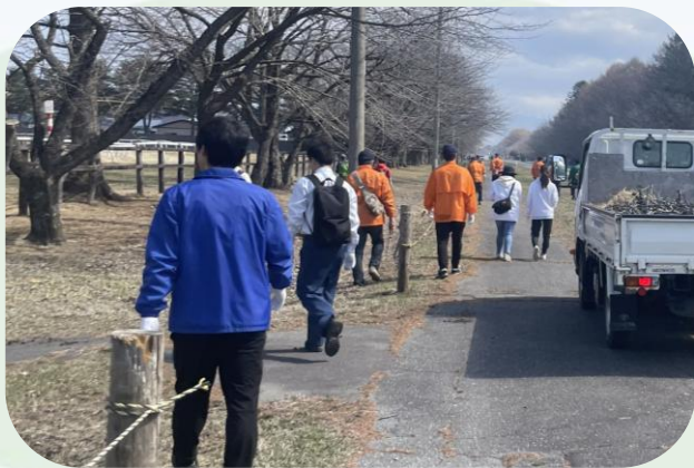
▲二十間道路桜並木環境保全活動 (静内支店)