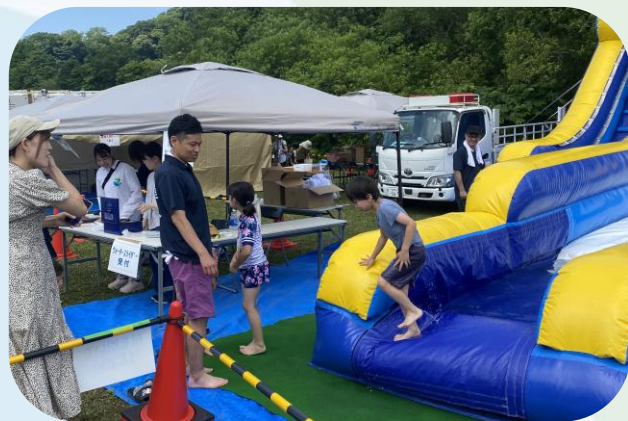
▲みついし蓬莱山まつり2025 （三石支店）