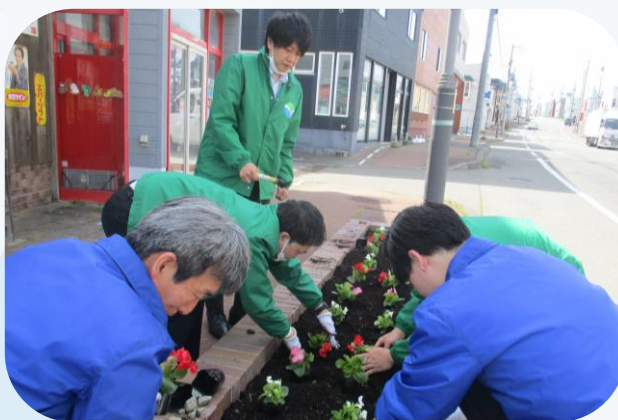
▲本町商店街協同組合主催の 花壇の定置 (えりも支店)