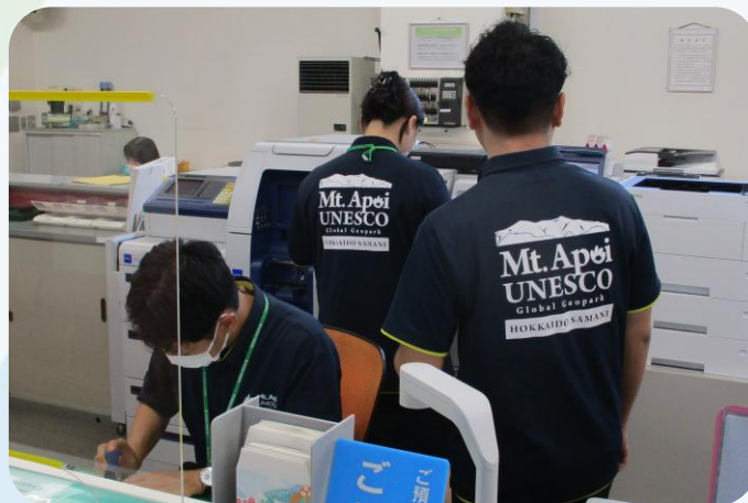
▲アポイ岳ジオパーク推進DAY