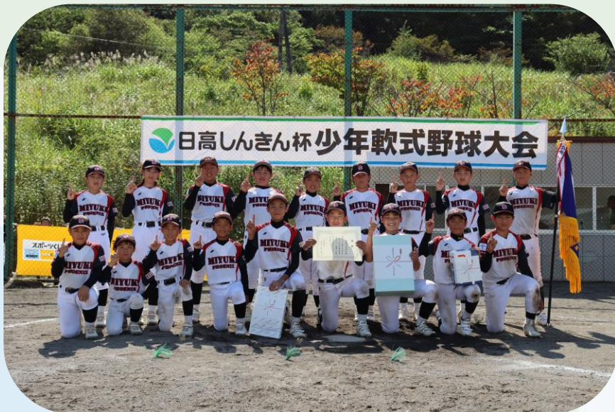
▲みゆきフェニックス (優勝)