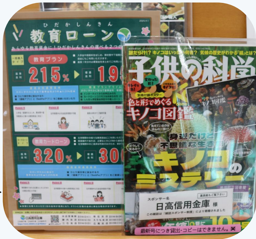
当金庫の寄贈雑誌「子供の科学」▶