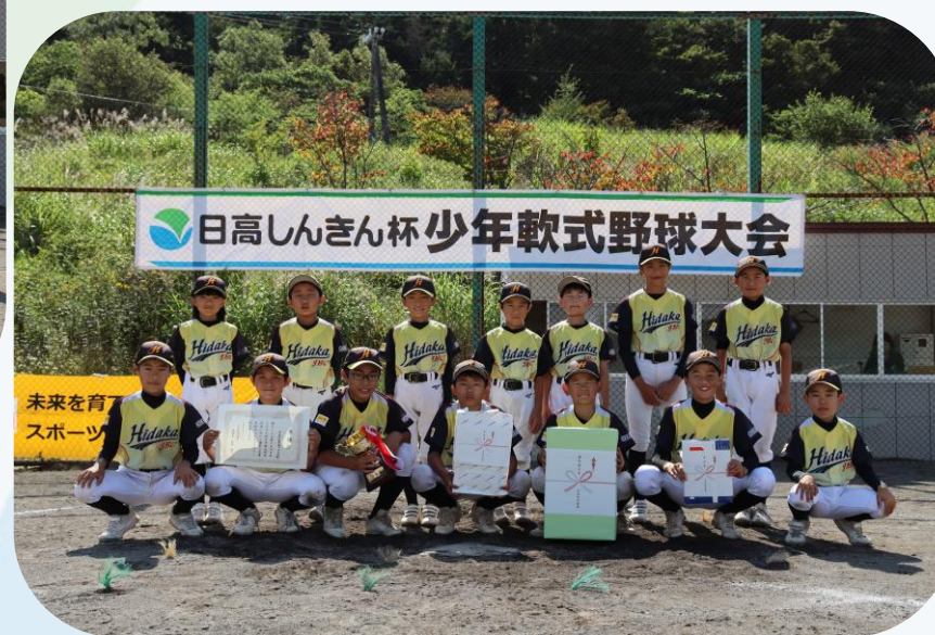
▼JBC日高ブレイヴ (準優勝)