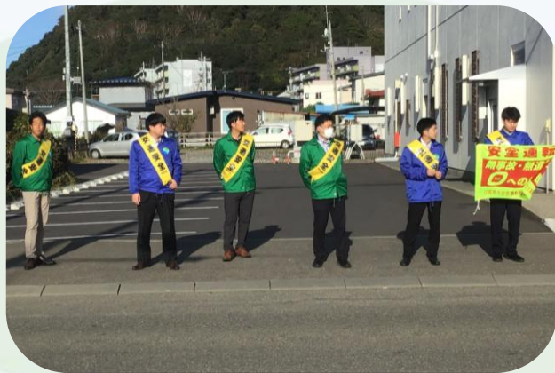
▲交通安全街頭啓発（浦河地区合同）