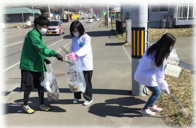
▲「クリーンアップデー」の様子 （大通、堺町ほか）