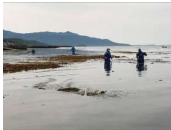
手作業で取り除いている状況