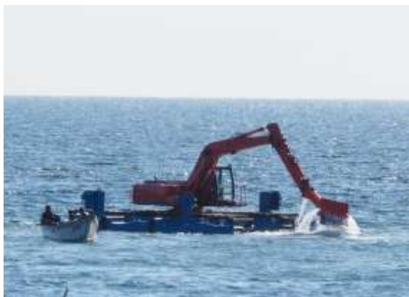
雑海藻駆除機で取り除いている状況

コンブは、秋口にコンブのタネとなる遊走子と呼ばれる胞子を出し、それが海底の岩盤などに着生することで、根を張り、成長していきます。しかし、着生する岩盤などに他の海藻が大量に繁茂してしまうと着生する場所を狭くするだけでなく、コンブの生長に必要な光合成を妨げてしまいます。そこで、漁業協同組合では手作業や雑海藻駆除機を用いて雑海藻を取り除くことでコンブの着生場所を確保して、成長しやすい環境を作っています。