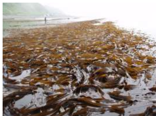
コンブが繁茂している様子