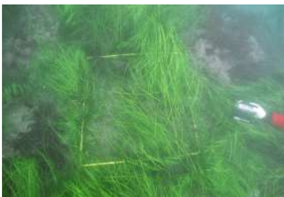
雑海藻が繁茂している様子