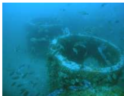
周りに魚が集まっている様子