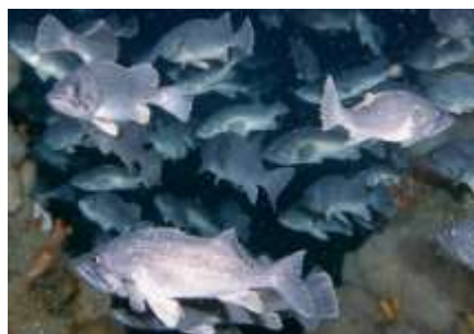
ソイが集まっている様子