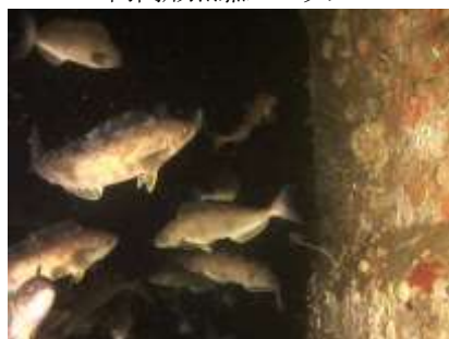
ホッケが集まっている様子