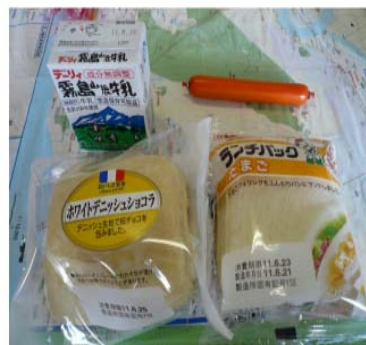
パン2こ、牛にゅう、ソーセージ