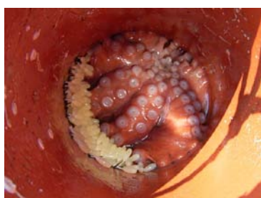
土管に生み付けた卵を守る親ダコ