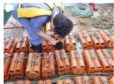
稚ダコ保護用の土管