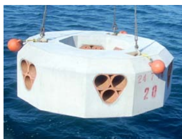
ヤナギダコ用ブロック