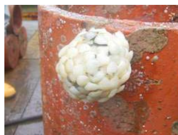
土管に生み付けられたツブの卵塊