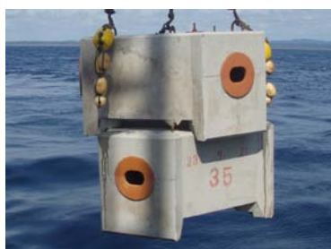
ミズダコ用ブロック

ツブもまた、海底の岩場に産卵しますが、設置した素焼き土管などにも産卵が確認されており、より一層の資源の増加が期待されています。