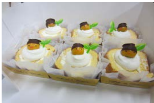
競馬場で販売された「ほおずきロール」

○問い合わせ先 門別競馬場 沙流郡日高町門別駒丘76番地1 TEL:01456-2-4110