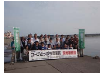
(コープさっぽろ農業賞現 地審査会の様子)

こうした地道な取り組みが評価され、「コープさっぽろ農業賞（漁業の部）奨励賞」を受賞（平成19年・22年）したほか、地場産食材を活用した北海道らしい特色のある料理を作っているということで「北海道らしい食づくり名人」に登録される等、多くの人に活動を知ってもらえるようになりました。