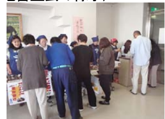
(日高振興局での販売会)

水産物の更なる普及を目指し、商品開発にも余念がありません。浦河町で開催された日高産品取引商談会では、自分たちが作った商品を持ち込んで道内外のバイヤーや有名料理店のオーナーと商談を行い、商品の良さをアピールするとともに、さまざまなアドバイスを熱心に受けていました。また、自慢の商品を味わってもらおうと、日高振興局で販売会を行いました。手作り商品の安心感と浜のかあさんの元気の良さが人気を呼び、売り切れ商品が出るほど盛況でした。