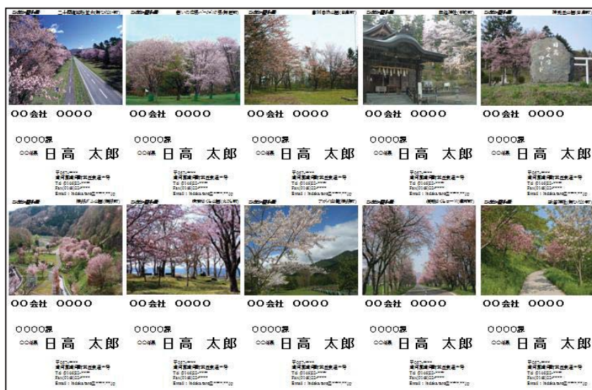
「ひだか桜十景」名刺フォーマット（おもて面）