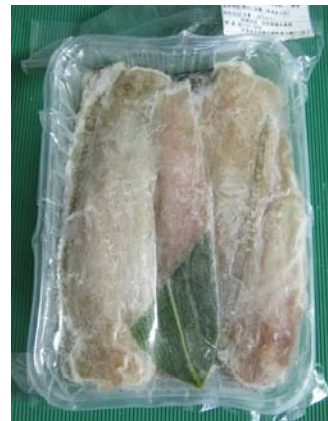
宗ちゃんの骨抜き干しカレイ スティック