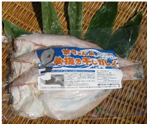
宗ちゃんの骨抜き干しカレイ

この商品の特徴としては、焼き魚器やグリルがないご家庭でも、フライパンでお気軽に焼くことが出来、煮魚やムニエル、唐揚げなど様々な料理に利用できるということ。また、骨を抜いているので、お子様からお年寄りまで簡単に食べることが出来、調理時間も短時間ですむことから、非常にエコな商品となっています。