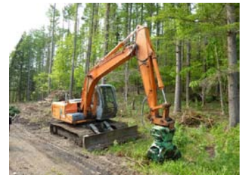
林内作業をする林業機械(グラブ)。

※提案型集約化施業とは、森林施業の方針・施業に必要な経費・林産物の販売見込額等を含む具体的な施業プランを作成して、森林所有者に提案し、森林施業を受託・集約化する取組