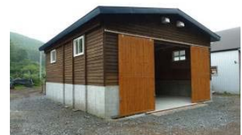
地域材を活用したオガ粉保管庫(12設置)

これらの取組みと地元の基幹産業である酪農に必要なオガ粉の生産や、学校の教育環境の美化に取り組んでいるほか、組合経営の安定化により地元の大きな雇用の場になるなど、地域の森林・林業の発展のみならず、地域社会の発展に大きく貢献していることからこのたびの表彰となりました。