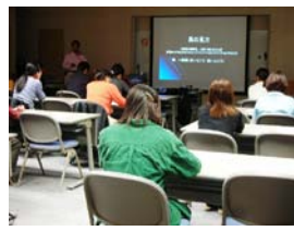
(H22. 3, 5, 10の技術研修)